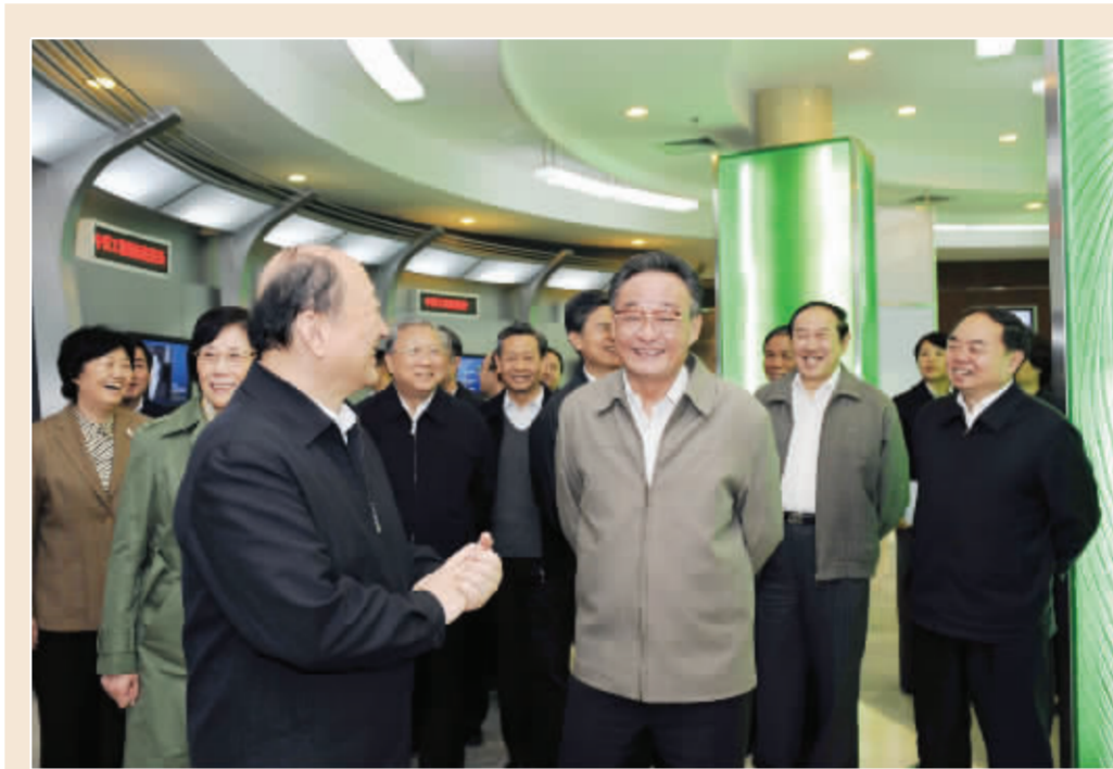
吴邦国考察中国工程院 中共中央政治局常委、全国人大常委会委员长吴邦国4日考察了中国工程院并与部分院士进行座谈。他强调, 要充分发挥中国工程院之优势, 开展战略性、前瞻性、综合性工程科学技术研究与咨询, 为推动产业结构优化升级, 占领国际产业竞争制高点作出新的更大贡献。吴邦国提出三点希望: 一要瞄准世界科技前沿实现重点突破。二要构筑科技创新平台促进科技体制机制改革。三要加强对科技人才培养建设好学术梯队。

在公正廉洁方面, 准则规定, 证监会工作人员不得利用职务上的便利收受礼金和各种有价证券、支付凭证, 不得违反规定收受礼品, 不得接受可能影响公正执行公务的宴请以及旅游、健身、娱乐等活动安排, 不得接受或者无偿借用监管对象提供的交通工具、通讯工具和其他设备物品。 相关报道详见封二